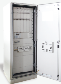
Модульная станция катодной защиты «Тайга»